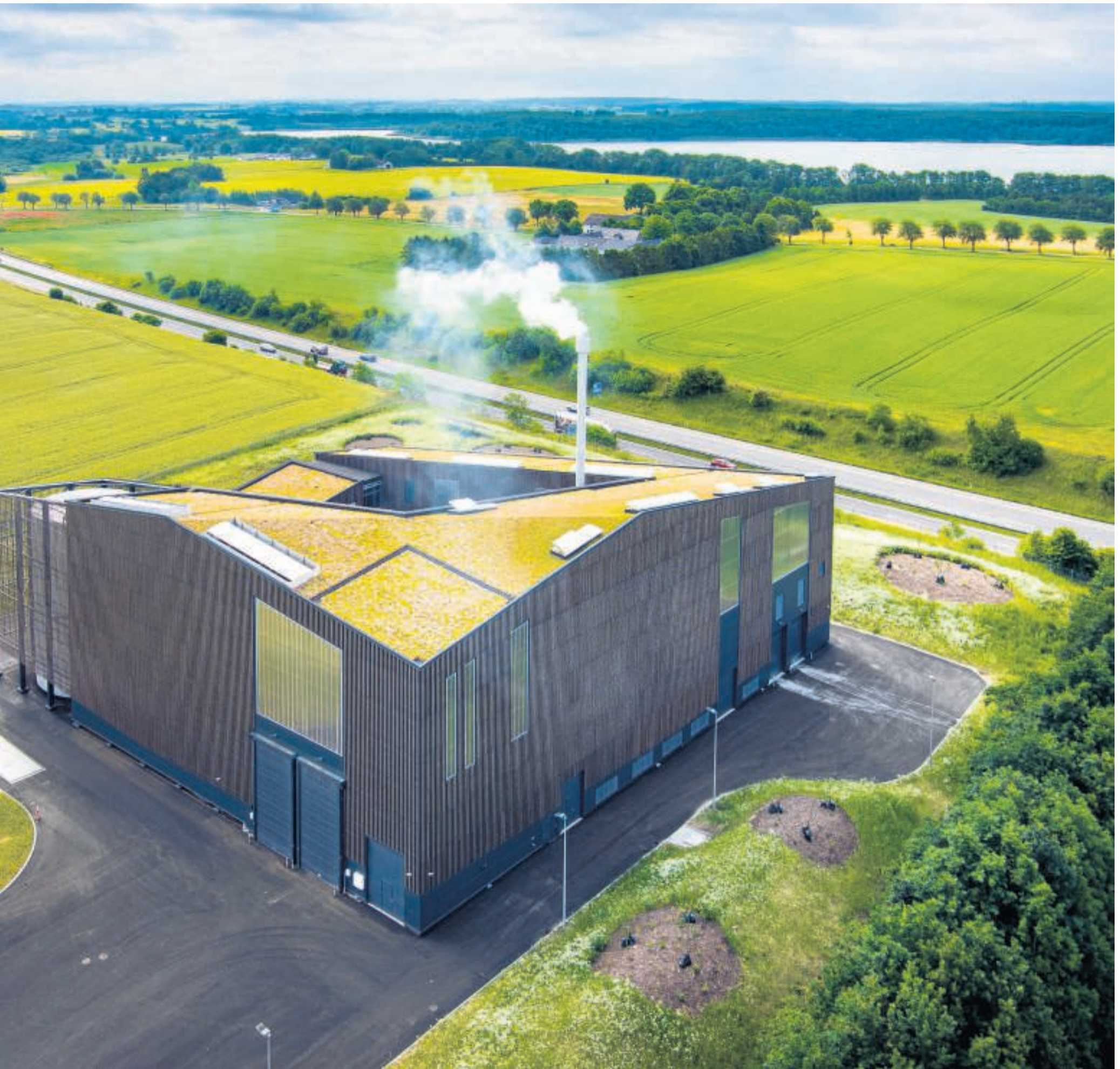
Dall Energys forgasningsteknologi er i brug hos Sorø Bioenergi. Som det eneste anlæg i Danmark brændes der her 100 procent park- og haveaffald.